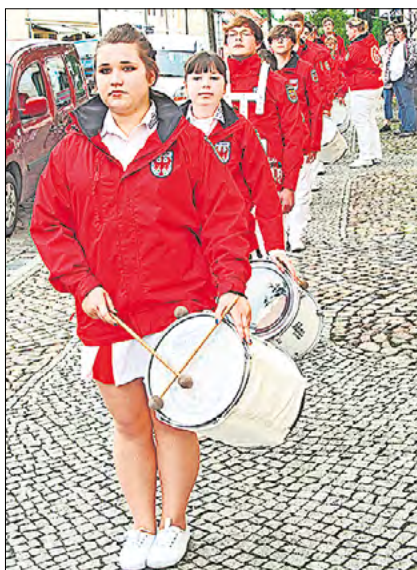
Der Fanfarenzug Templin tritt gemeinsam mit Freunden auf.

Und von der Bühne abgehen, kommen alle Besucher des Stadtfestes natürlich mit unseren Linienbussen komfortabel und unkompliziert ganz nahe an die Party ran – und wieder nach Hause! Dies gilt auch für alle anderen großen Festivitäten, die in der Uckermark gegenwärtig für den Sommer vorbereitet werden. Auch das Nationalparkfest in Criewen oder das traditionelle „Energie Open Air“ am Wollletzsee bei Angermünde sollten Sie nicht verpassen. Fürs Hin- und Wegkommen sorgt Ihre UVG!