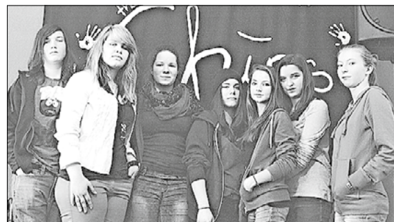
Die Schülerband „The Chips“ aus Prenzlau bietet Rock&Pop von Adele bis zu The Beatles.