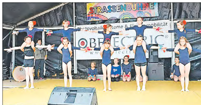
Dass im „Hort Zauberlehrling“ nicht nur Hausaufgaben erledigt werden, stellt die Turngruppe unter Beweis.