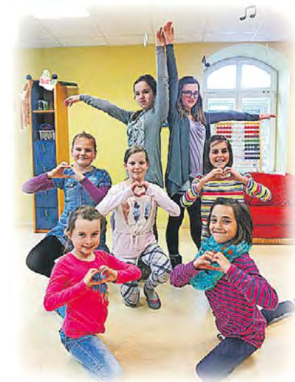
„Herzliche Grüße senden die Hortkinder aus dem „Zauberlehrling“.