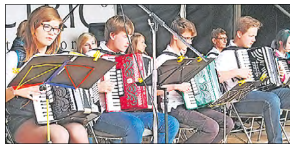
Ihr Name „Happy Harmonikas“ zeigt, dass es in der Musikschule Fröhlich nicht bierernst zugeht.