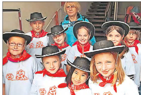
Im Hort der Templiner Egelpfuhr-Schule gehört Tanzen zu den Lieblingsbeschäftigungen.