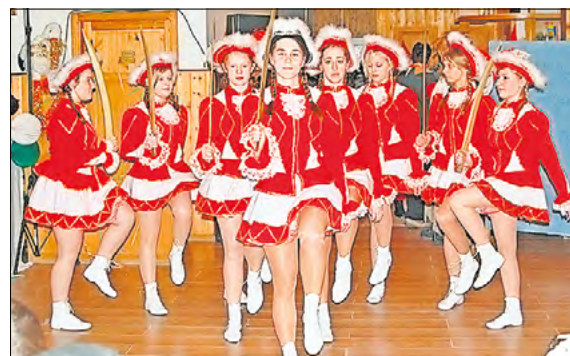
Seit 30 Jahren ruft Röddelin beim Karneval „Röddi helau“ – auch für die Funkgarde.