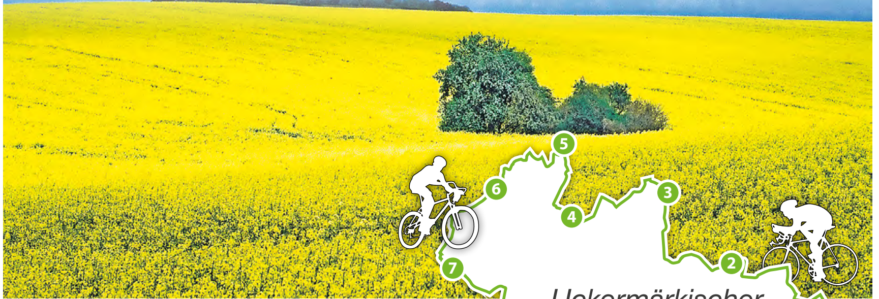
Flache Hügel und satte Rapsfelder – so präsentiert sich die Uckermark (auch) den Radfreunden im Frühjahr.