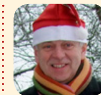
Jürgen Polzehl, Bürgermeister Schwedt/Oder