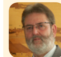
Wolfgang Krakow, Bürgermeister Angermünde

„DARUM UVG“ fragte die Bürgermeister von Angermünde, Prenzlau, Schwedt und Templin nach ihren städtischen Weihnachtsschmuckstücken! Wir wollten wissen: