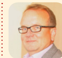
Detlef Tabbert, Bürgermeister Templin