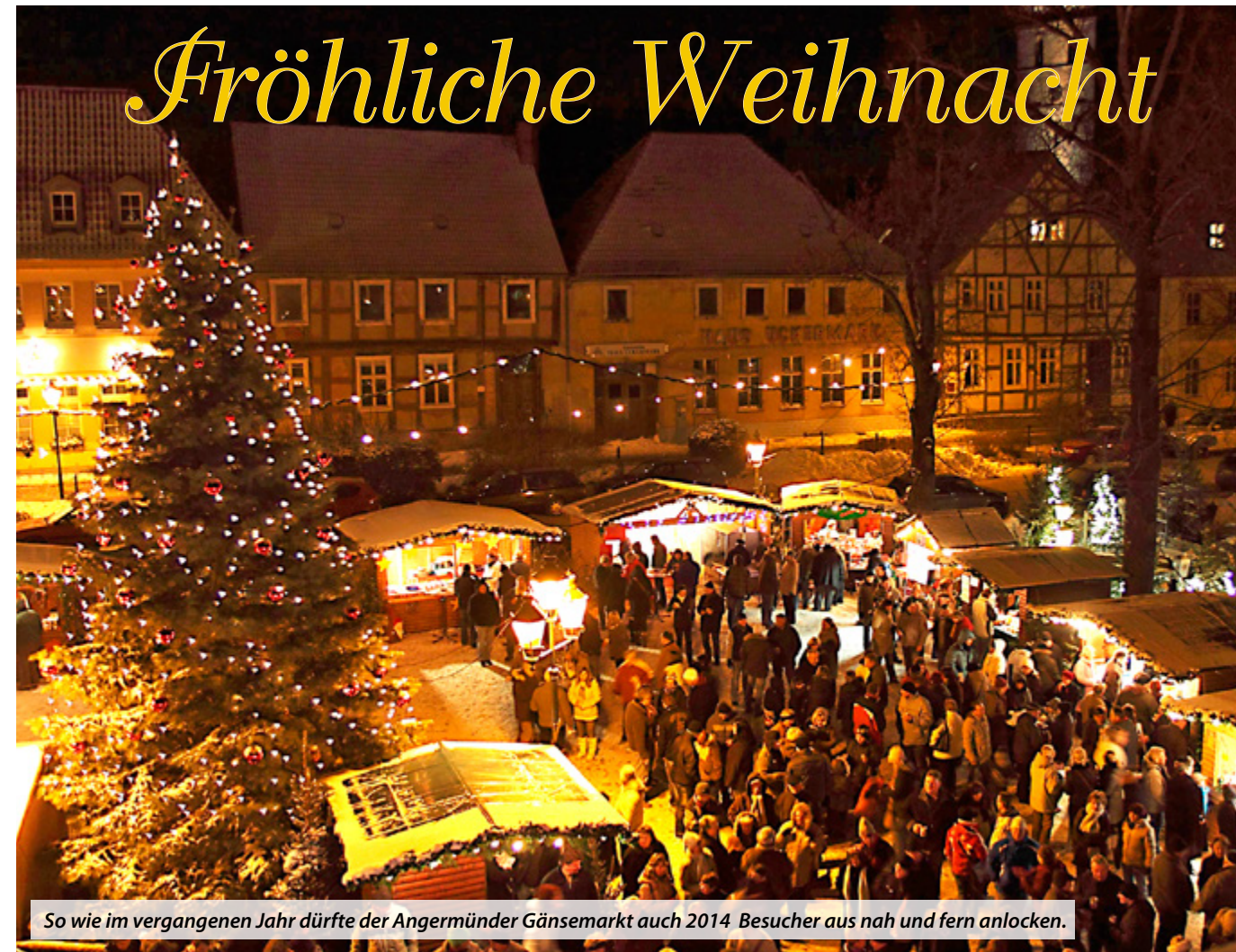
So wie im vergangenen Jahr dürfte der Angermünder Gänsemarkt auch 2014 Besucher aus nah und fern anlocken.