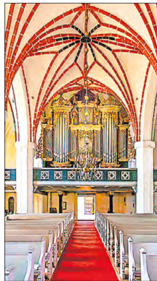
Die Joachim-Wagner-Orgel von St. Marien mit ihren 30 klingenden Stimmen gilt als eines der bedeutendsten Instrumente seiner Art in Brandenburg.