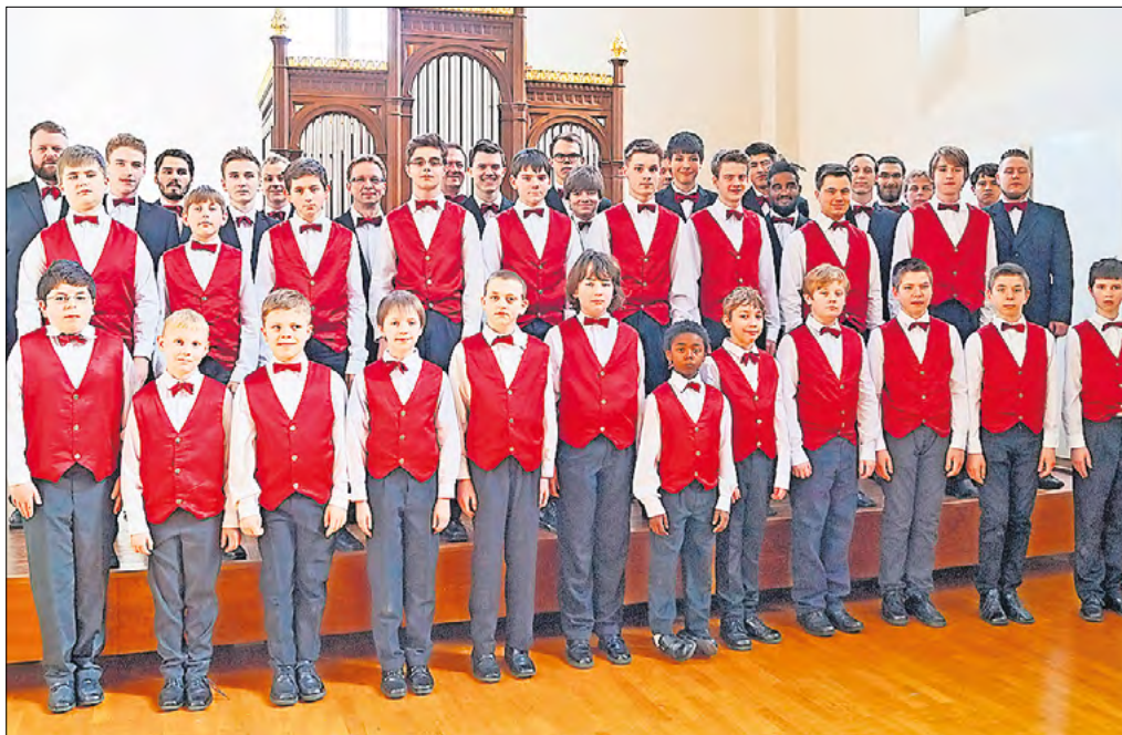
Genau 60 Jungen und junge Männer gehören zum einzigen Knabenchor der Landes Brandenburg. Zweimal in der Woche proben die Sänger in der Konzerthalle „Carl Philipp Emanuel Bach“.

Genießen Sie stimmungsvolle Weihnachten à la Uckermark