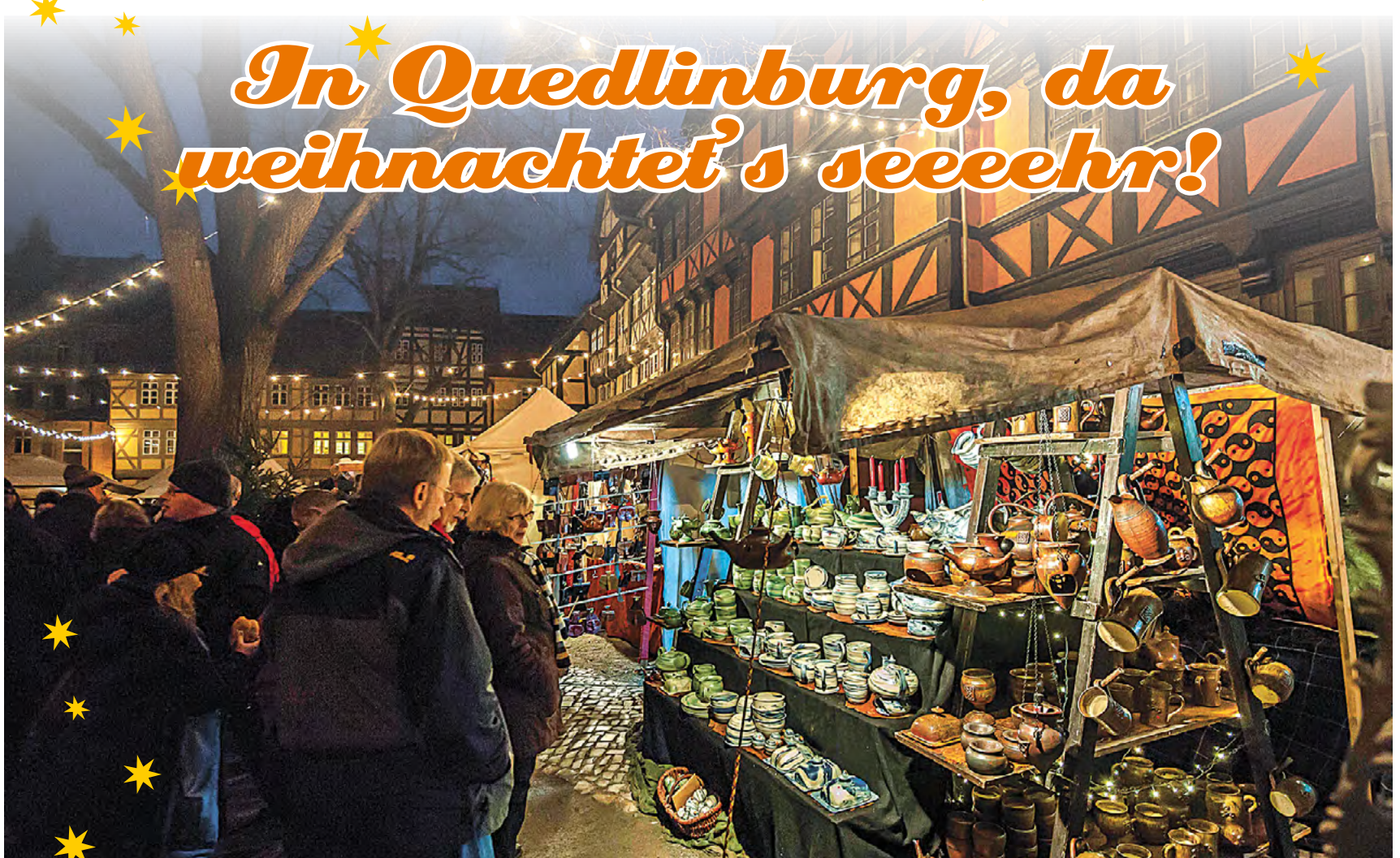
Für den einmaligen Charme des Quedlinburger Weihnachtsmarktes sorgt die Kulisse aus Jahrhunderte alten Fachwerkhäusern.