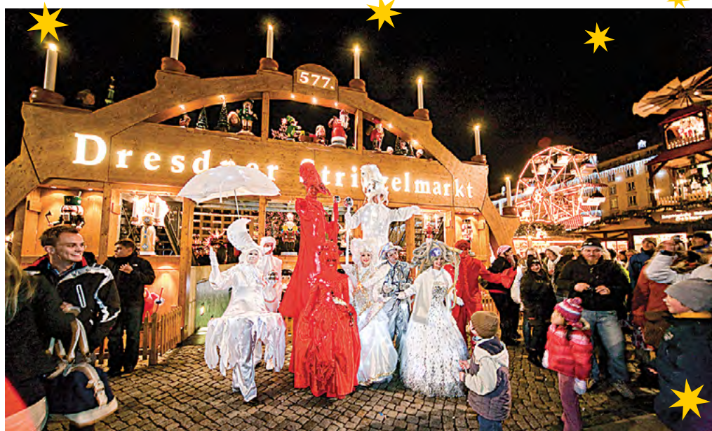
Der Striezelmarkt in Dresden ist der älteste urkundlich erwähnte Weihnachtsmarkt Deutschlands.

besonders freuen! – begeht der Striezelmarkt sein jährliches Stollenfest mit einem gigantischen Riesenstollen. Der traditionelle Dresdener Christstollen genießt wegen seiner Qualität und Historie einen besonderen Markenschutz und darf nur in rund 120 Bäckereien in und um Dresden gefertigt werden. Künstliche Konservierungsstoffe und Aromen sind streng verboten! Sowohl bei der Reise nach Quedlinburg als auch Dresden ist die Ankunft gegen 11 Uhr geplant und die Rückfahrt gegen 16:30 Uhr.