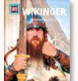
„Winkinger“ Was ist was?