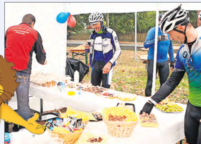
Beim Hügelmarchon als RadTourenFahrt (RTF) heißt das Motto der Fahrer: Die Teilnahme zählt! An den Verpflegungspunkten nimmt man sich daher auch die Zeit für ein kleines Schwätzchen.

DARUM UVG: Sie stehen am Kilometer 166 Kilometer der Ma-