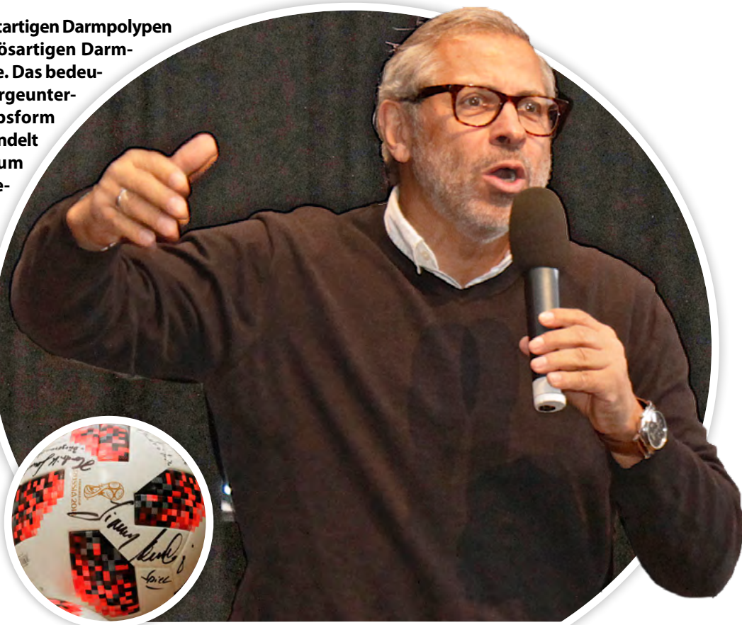
Jimmy Hartwig – ehemaliger Fußball-Profi, mehrfacher Deutscher Meister (mit dem HSV) und Nationalspieler. Heute steht er als u. a. Schauspieler auf Theaterbühnen und engagiert sich als AOK-Botschafter für die Darmkrebs-Vorsorge.

Bei Jimmy Hartwig hat der Tod nicht gesiegt. Dabei verließ sein Angriff auf breiter Front: Hodenkrebs, Prostata-Krebs und Gehirntumor. Wenn er heute als Gesundheitsbotschafter der AOK-Nordost für die Vorsorge trommelt, nimmt er gerade deshalb – weil er überlebt hat! – kein Blatt vor den Mund. Nicht das kleinste. „Dass die Ärzte mein Gehirn