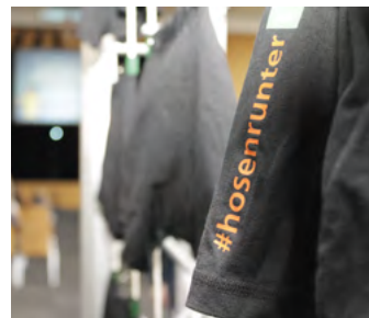
Unter dem Hashtag #hosenrunter ist die Kampagne auch in den Social Media aktiv.

Spätestens wenn Sie Blut in Ihrem Stuhl entdecken, ist es höchste Zeit für einen Besuch des Hausarztes – und unter Umständen eine Koloskopie. Die rund 20-minütige Darmspiegelung ist für eine Früherkennung die zuverlässigste Methode und wird entweder von einem Gastroenterologen oder ambulant im Krankenhaus durchgeführt. Während dieser unter Betäubung durchgeführten Untersuchung wird eine kleine Kamera, ein Endoskop, zur Begutachtung des Dickdarms und der Darmschleimhaut auf Auffälligkeiten eingeführt. Polypen kann der Arzt dabei sofort entfernen und eine Krebsbildung verhindern. Krankenkassen zahlen eine Koloskopie meist für Männer ab 40 und Frauen ab 45.