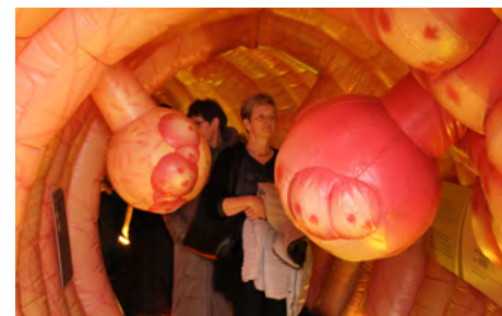
Im Darm-Modell der AOK Nordost wird sichtbar und erlebbar, was bei der Krebsvorsorge beim Arzt hoffentlich nicht zu Tage tritt.