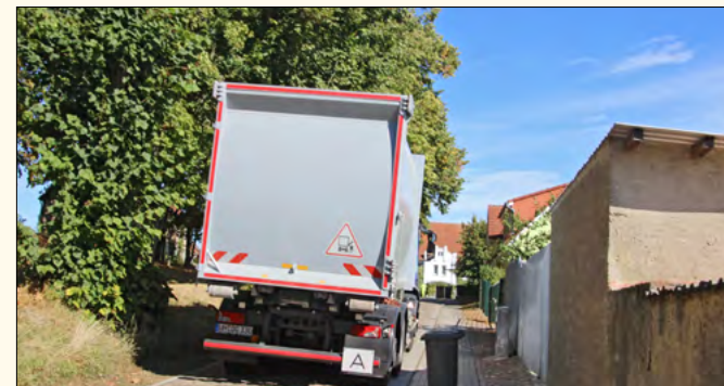
Auch in engen Straßen hat unser neues Fahrzeug keine Probleme, die Tonnen aufzunehmen.

Hier können Sie sich den „Jobtausch“ von Uckermark TV bei der UDG noch einmal anschauen: