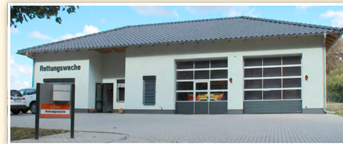
In der neuen, modernen Rettungswache von Boitzenburg ist neben dem Notfallteam für zwei Rettungswagen Platz.

sind ja schneller beim Patienten als umgedreht, und unter Umständen kann er oder sie gleich im passenden Krankenhaus angemeldet werden.“ Ende Dezember 2014 zieht das Boitzenburger Rettungsteam in die moderne Wache in der Goethestraße am Ortsrand um: Aufenthalts- und Umkleideräume, Büro, Ruheräume,