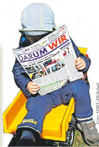
DARUM WIR – auch für die Kleinen ist das feiner Lesestoff!

leicht eine schöne Idee? Wie soll unser Mini-Helfer heißen? Wir freuen uns auf Vorschläge per E-Mail an darumwir@spree-pr.com . Die Namen, die von den URG-Kollegen als die besten ausgewählt werden, stellen wir in der nächsten Ausgabe der DARUM WIR zur Abstimmung. Wir freuen uns auf Ihre und Eure Post!