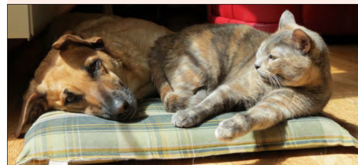
Manche bezeichnen Haustiere als „vierbeiniges Johanniskraut“ – sie geben Nähe, dem Tagesablauf einen festen Rhythmus und zwingen zu Aktivitäten, auch im Freien!

Weitere Therapieschritte werden Fachmediziner mit Ihnen besprechen!