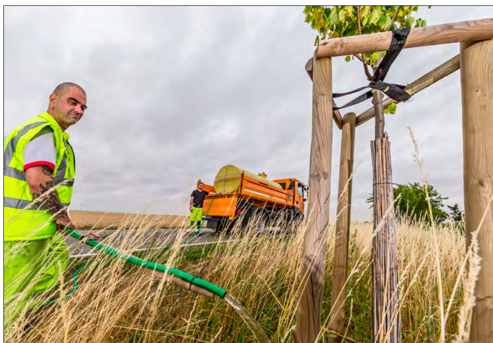
Ohne den „Wasser-Einsatz“ der Straßenwärter des Landkreises hätten es viele Bäume am 400 km umfassenden Kreisstraßen-Netz der Uckermark sicher nicht über den Sommer geschafft.