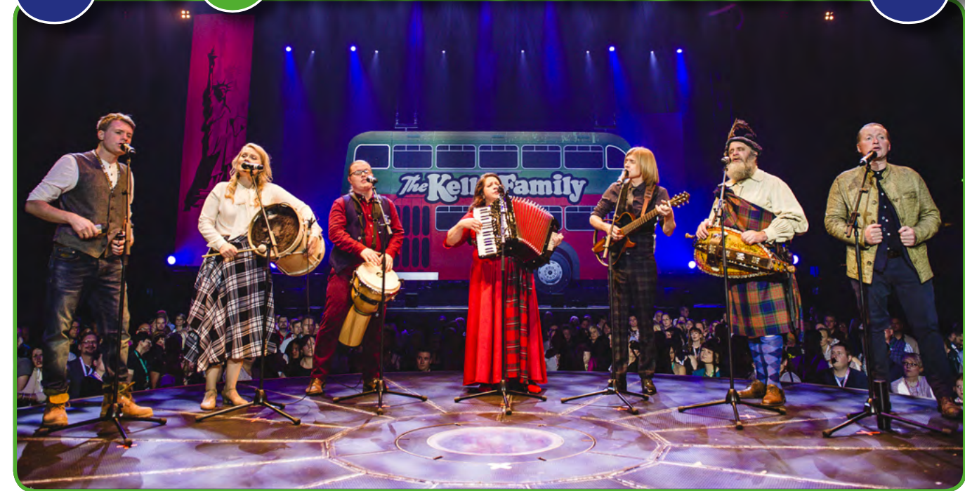
So sah es aus, als The Kelly Family 2018 auf „We Got Love“-Live-Tour war.