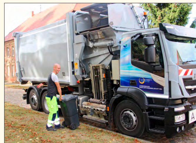
Das musste der Beifahrer bisher tun: Die zu leerende Tonne an den Wagen herschieben.