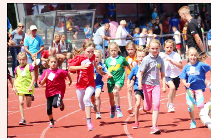
Schneller, höher, weiter! – Mehrere hundert Mädchen und Jungen aus der ganzen Uckermark messen sich Jahr für Jahr im fairen Wettstreit bei den Kinder- und Jugendsportspielen.

Dies ist ein Vorteilsangebot der UVG für ihre Transportleistungen zu verdanken. Auf diese Weise unterstützt unsere Verkehrsgesellschaft das An-